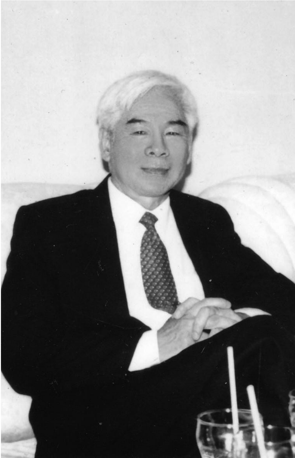
Trần Đình (1996)- (hình do tác giả Trần Đình cung cấp)